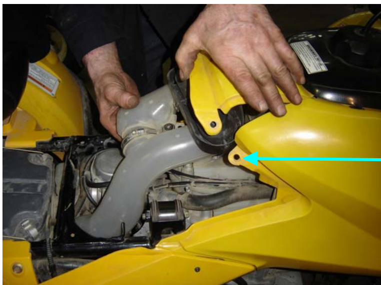
Vue de côté / Side view