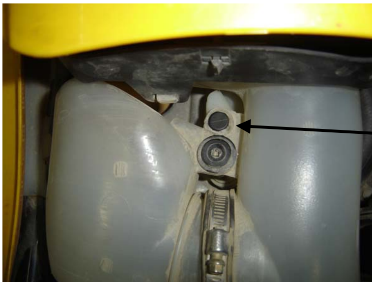
Vue de dessus / Top view