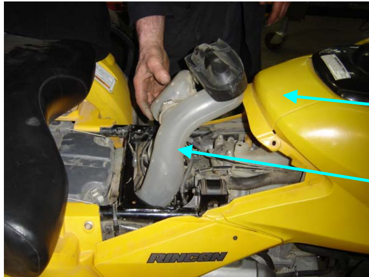
Vue de côté / Side view