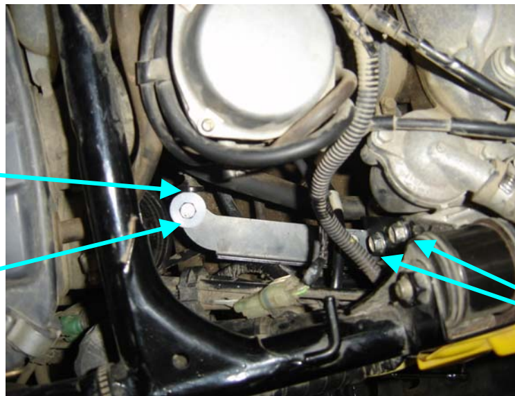
Vue de dessus / Top view